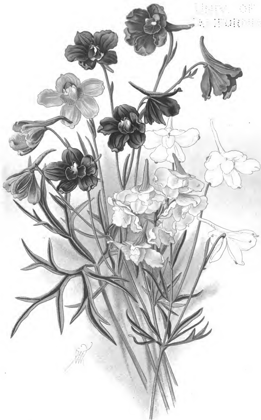
Delphinium sinense Fischer var. grandiflorum Hort.